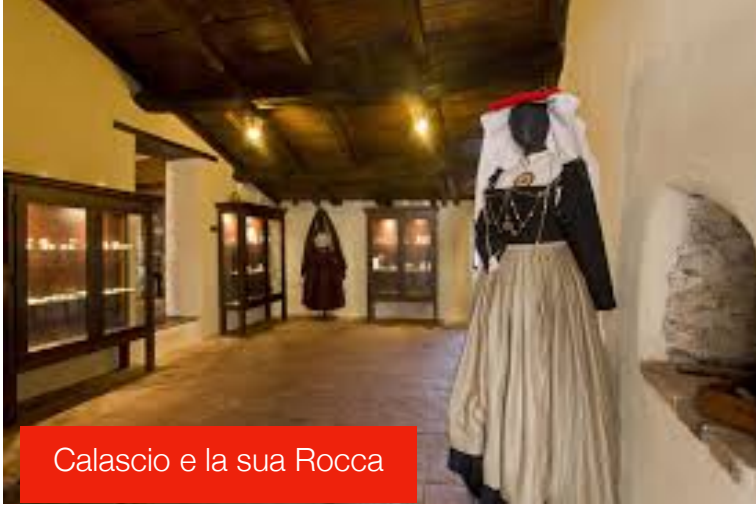
Calascio e la sua Rocca