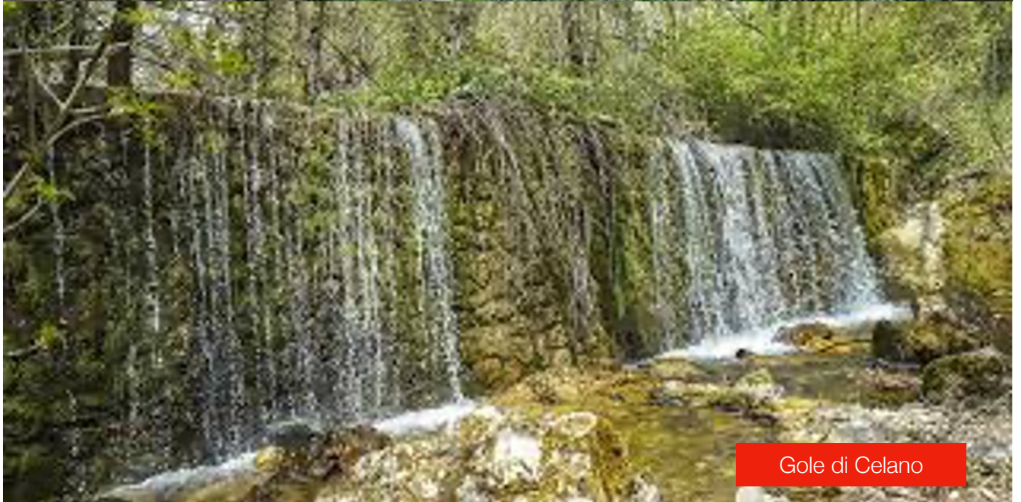
Gole di Celano