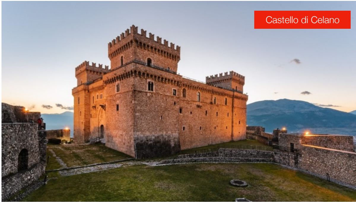
Castello di Celano

All'interno del casello ora si trova anche la sede del Museo d'Arte Sacra della Marsica e la Collezione Torlonia di Antichità del Fucino. Interessanti anche la chiesa parrocchiale di S. Giovanni Battista, quella di S.M. in Valleverde e della Madonna della Grazie.