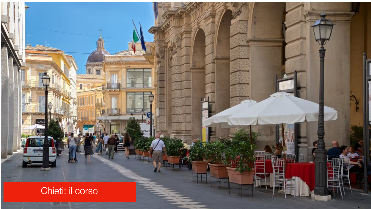
Chieti: il corso