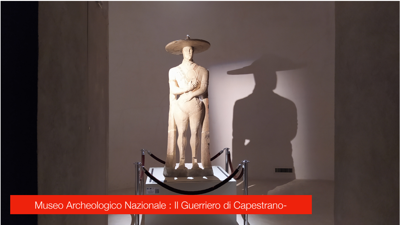
Museo Archeologico Nazionale : Il Guerriero di Capestrano-