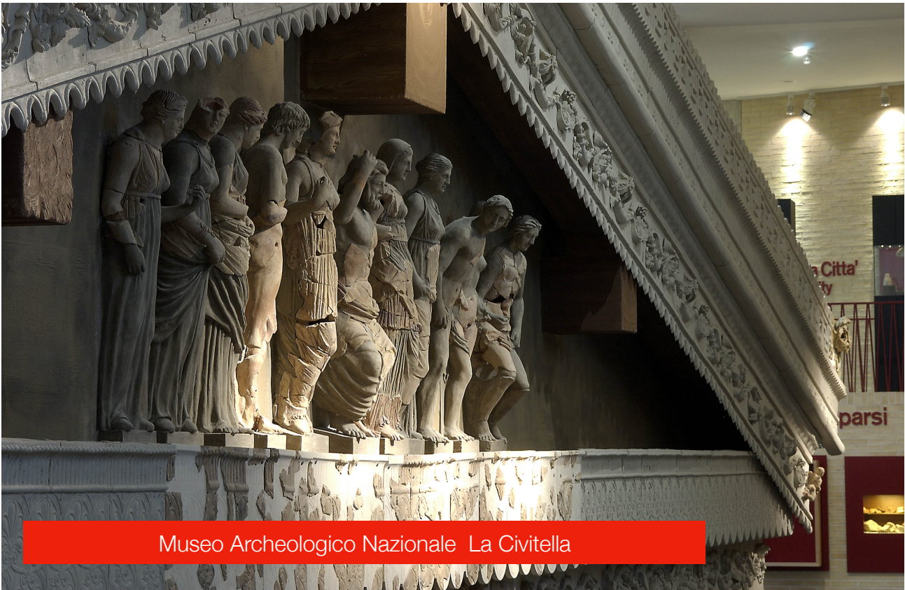
Museo Archeologico Nazionale La Civitella