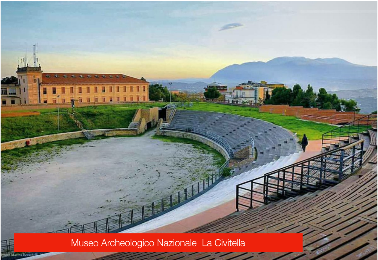
Museo Archeologico Nazionale La Civitella