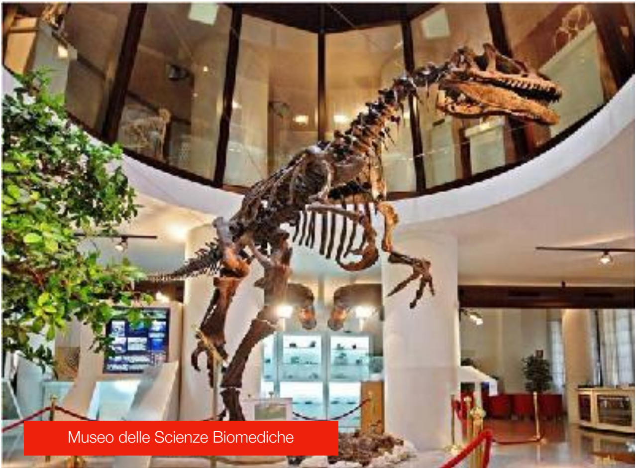
Museo delle Scienze Biomediche