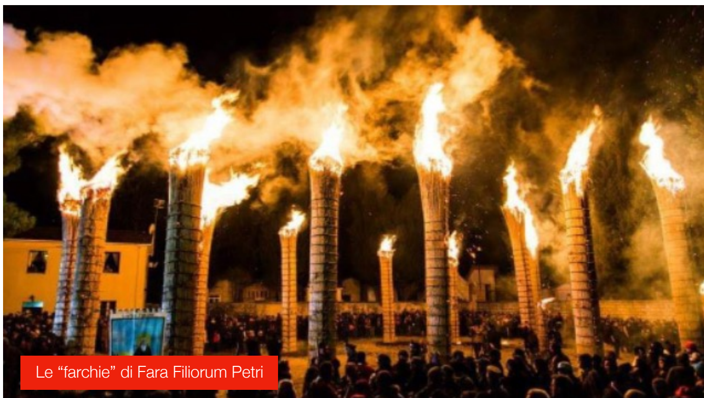
Le "farchie" di Fara Filiorum Petri

piazza del Duomo ospita la splendida Collegiata di Santa Maria Maggiore, realizzata interamente in pietra della Maiella e al cui interno è conservata una croce processuale di Nicola da Guardiagrele, mentre la Chiesa di San Francesco, situata nell'omonima piazza, custodisce le spoglie di San Nicola Greco. Altri luoghi di culto molto importanti sono la Chiesa di San Nicola di Bari, una delle più antiche della città ed eretta sui resti di un tempio pagano, la Chiesa di San Silvestro, il convento dei Cappuccini, la Chiesa di San Rocco, la Chiesa di Santa Maria del Carmine e la Chiesa di Santa Chiara.