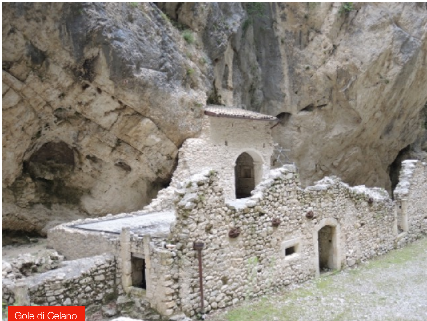
Gole di Celano

A fine passeggiata si potrà sostare nel punto di ristoro alle Sorgenti del Verde.