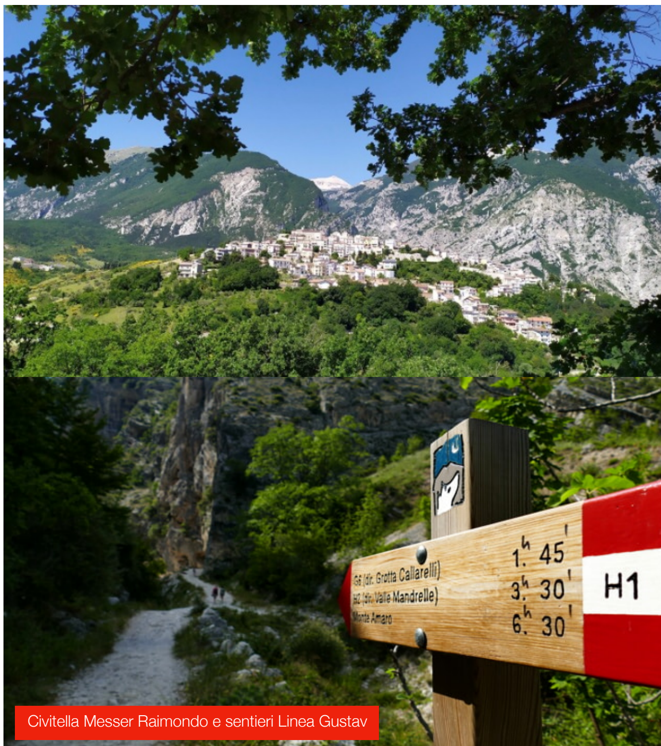
Civitella Messer Raimondo e sentieri Linea Gustav

resti nei monti circostanti (sentiero della libertà).