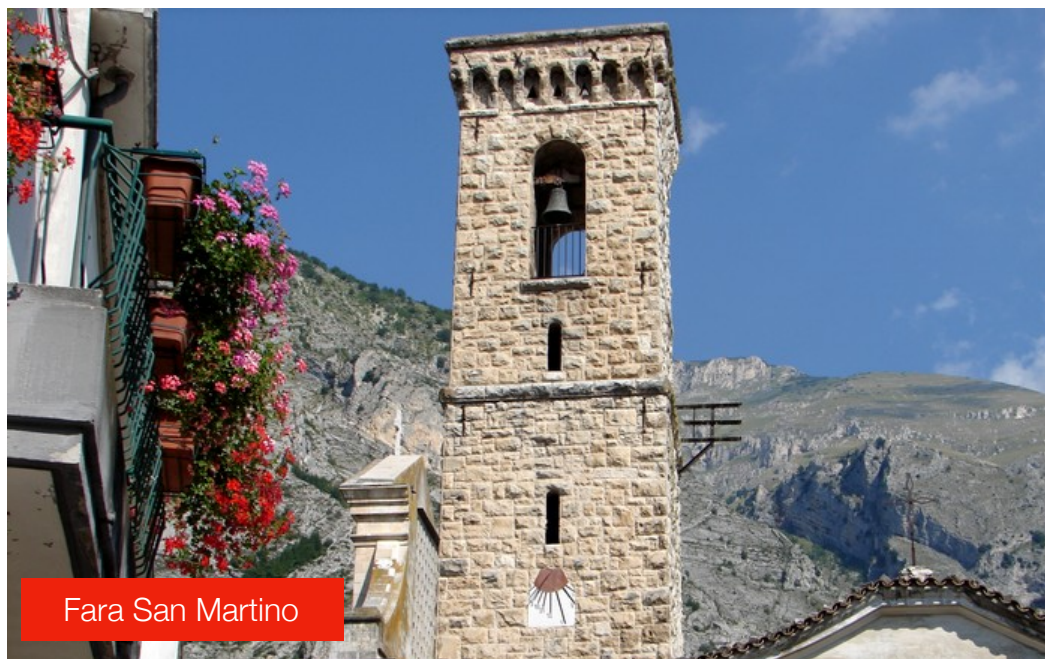
Fara San Martino

Pastificio Del Verde gestito da una multinazionale argentina, il Pastificio del Cav. Cocco che con le sue antiche trafilè di bronzo produce pasta artigianale e il Pastificio Farabella, nato da circa dieci anni e specializzata in pasta senza glutine.