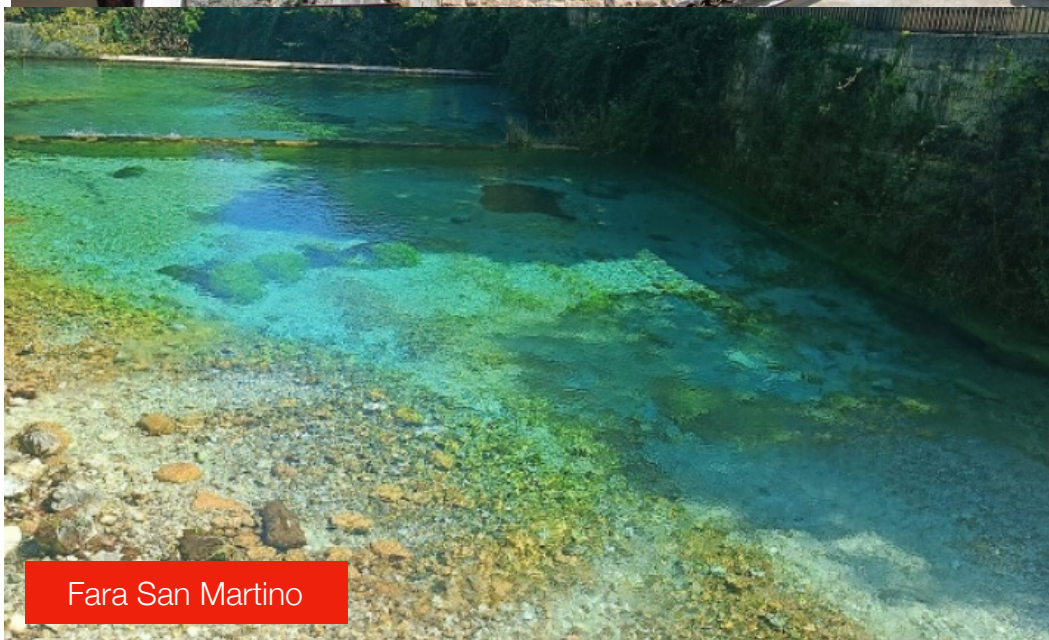
Fara San Martino