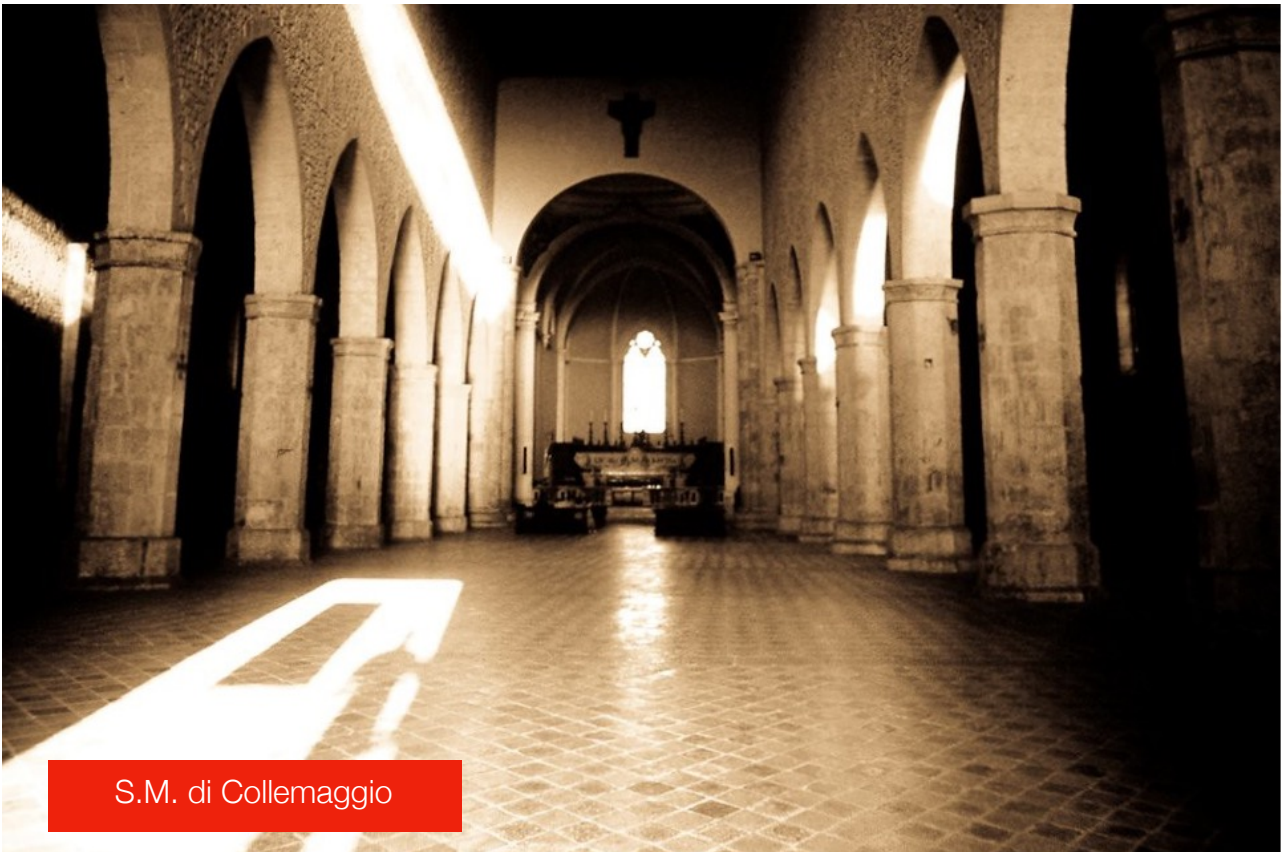
S.M. di Collemaggio