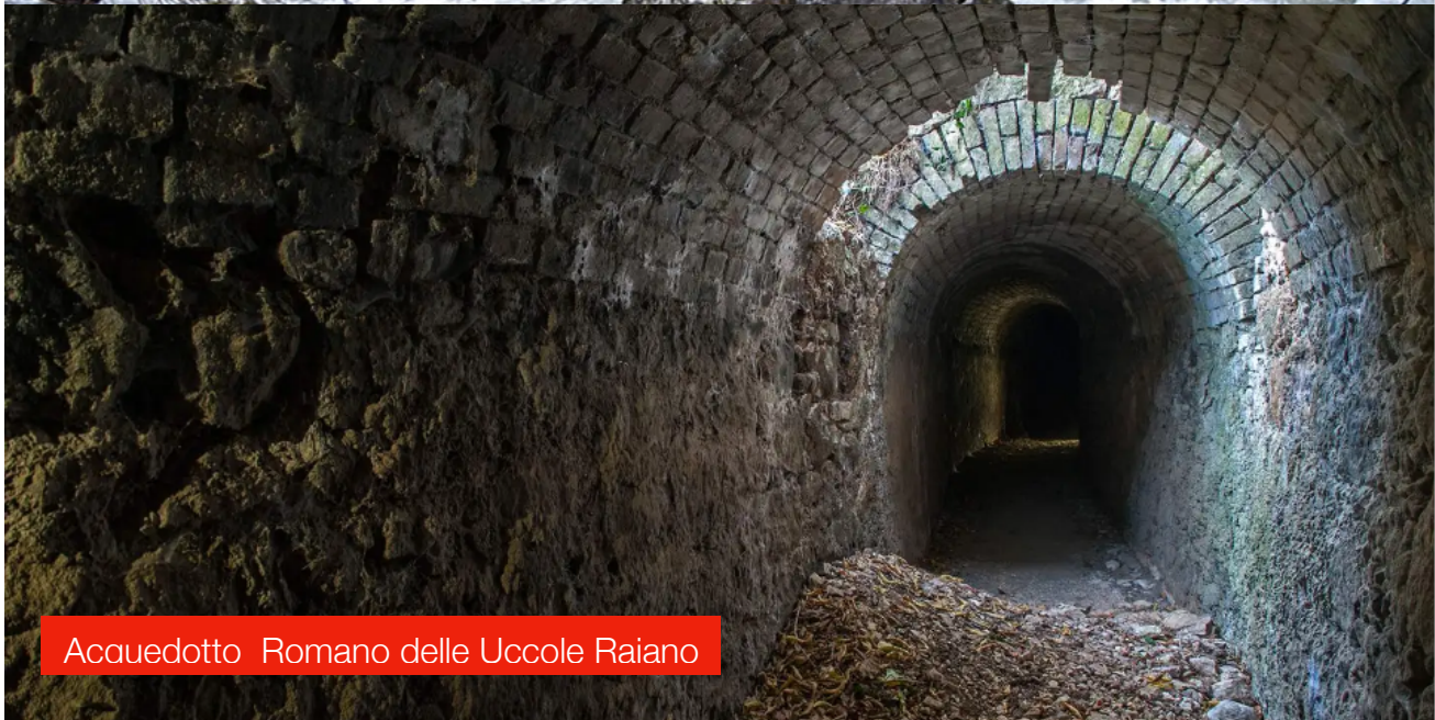
Acquedotto Romano delle Uccole Raiano