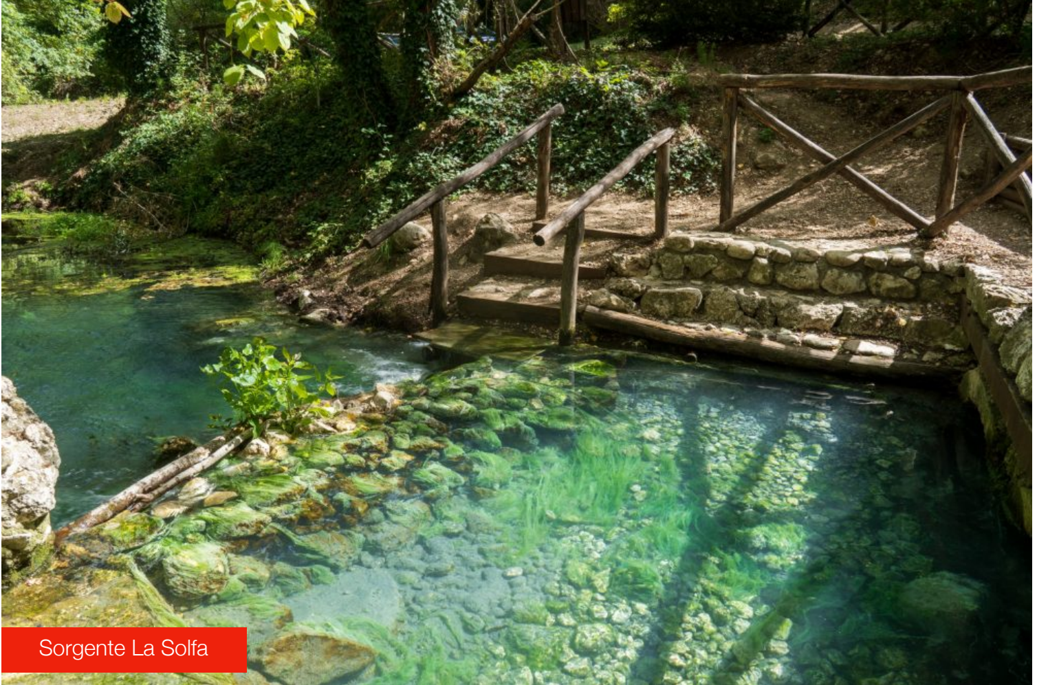
Sorgente La Solfa