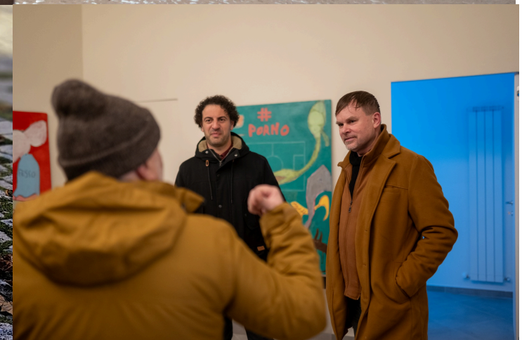
Arte Contemporanea a Fontecchio