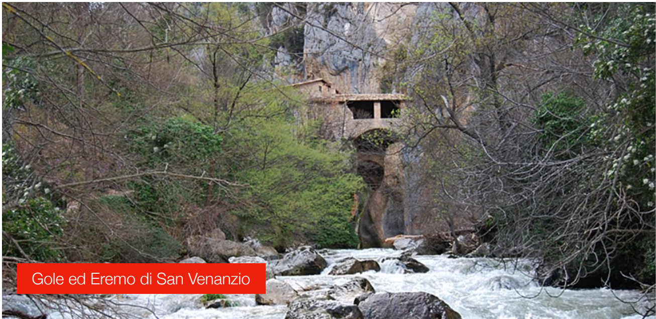
Gole ed Eremo di San Venanzio

Nel punto più stretto della gola, su un sistema di archi dove sotto scorre l'Aterno, si schiude come un miraggio davanti ai vostri occhi un santuario, è l'eremo di San Venanzio, fra boschi e terreni coltivati.