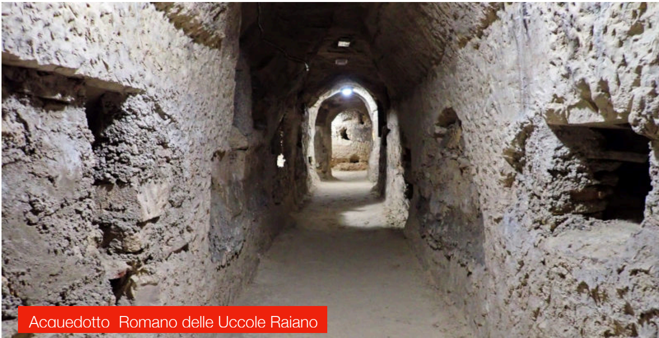
Acquedotto Romano delle Uccole Raiano

Ristorante Costa di Maggio Via del Rio, 67020 Fontecchio AQ Tel: 345 305 0285