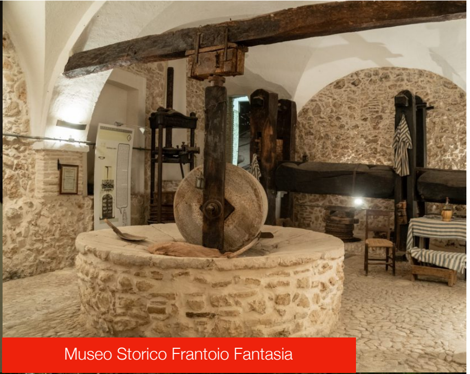
Museo Storico Frantoio Fantasia