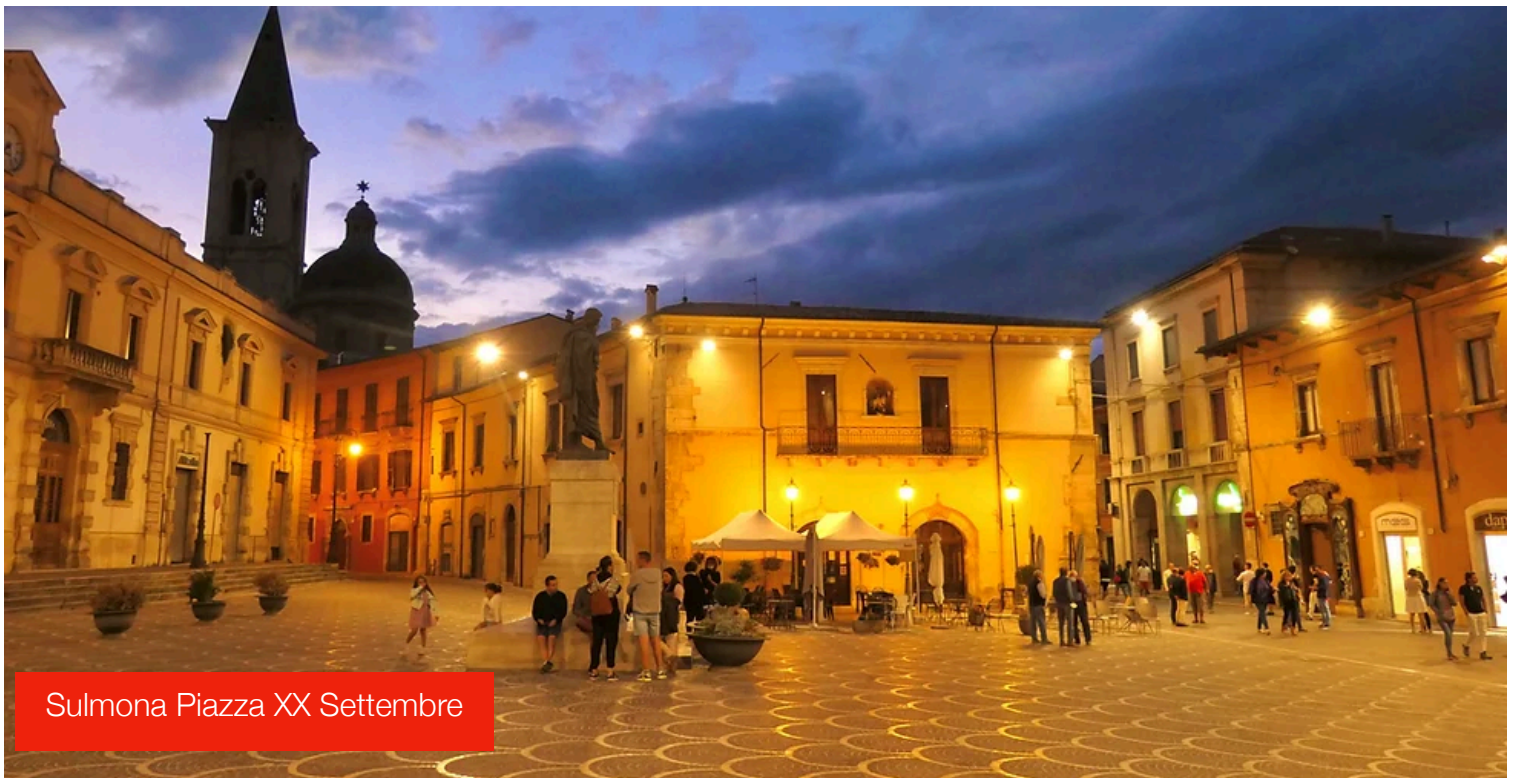
Sulmona Piazza XX Settembre

Imperdibile una visita alla fabbrica della Pelino, che ha fornito i confetti per tutti i matrimoni reali britannici degli ultimi decenni. Potrete visitare un interessante museo storico del confetto e lo spaccio aziendale, con ogni qualità di prodotto... e possibilità di assaggio prima dell'acquisto.