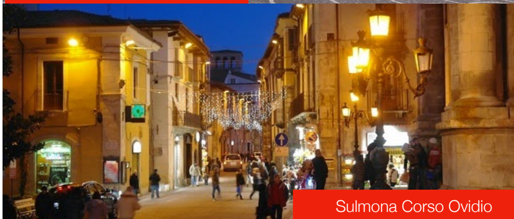
Sulmona Corso Ovidio