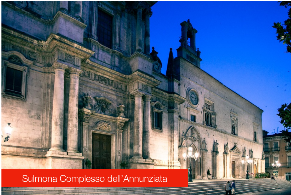
Sulmona Complexo dell'Annunziata