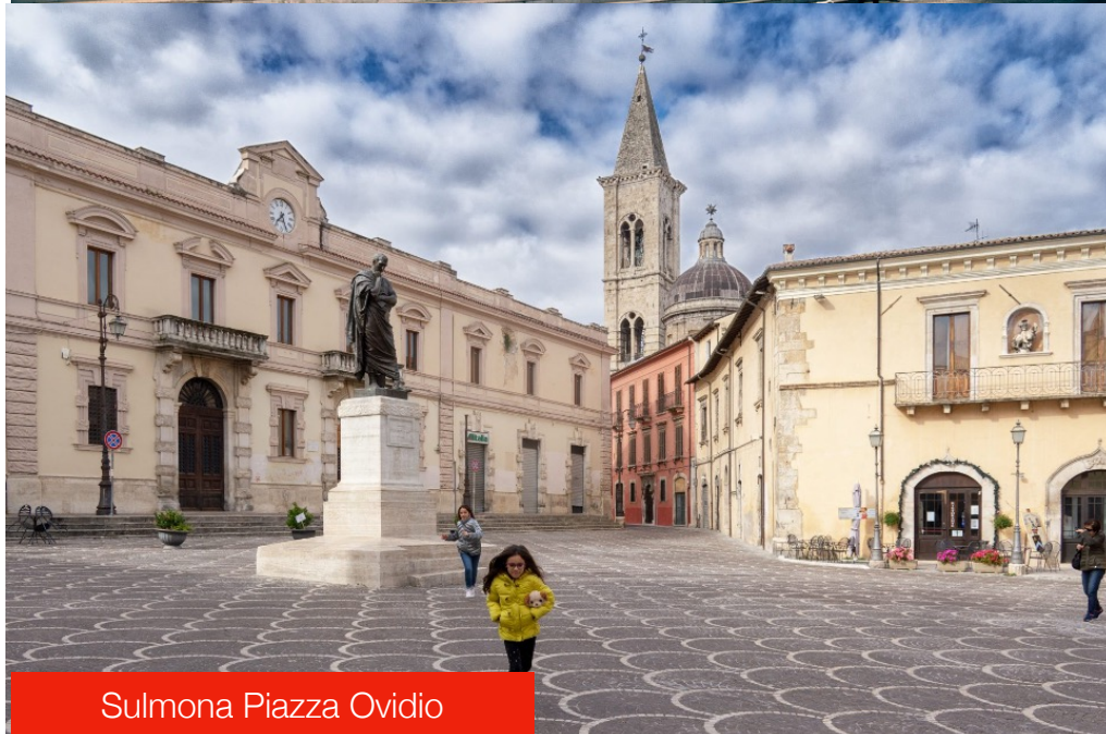
Sulmona Piazza Ovidio