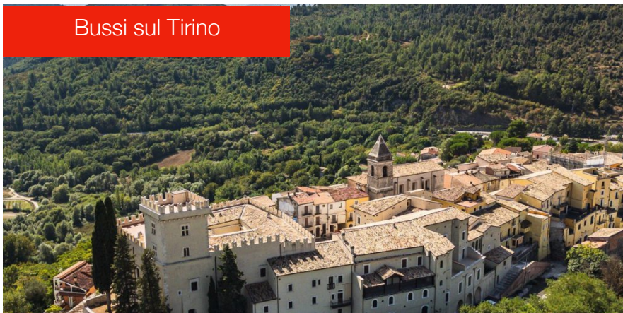
Bussi sul Tirino

Risto Macelleria Tirino Piazza Mercato, 5A, 67022 Capestrano AQ 346 499 3856