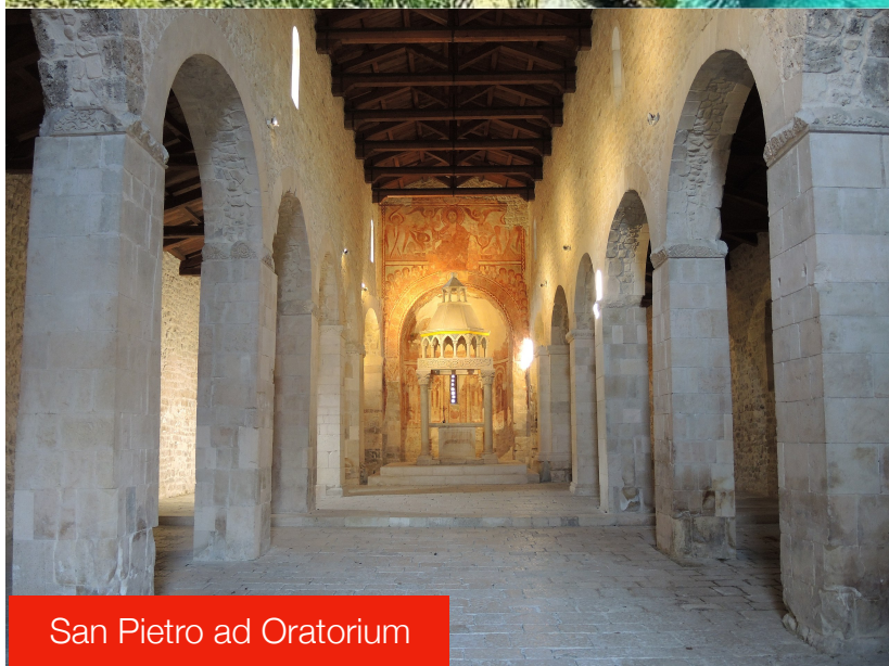
San Pietro ad Oratorium